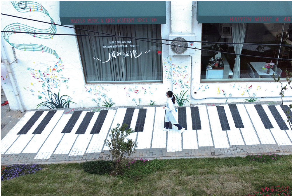
■市南区大尧三路一隅，居民在家门口与音乐、鲜花撞了个满怀。 邢志峰 摄于5月17日