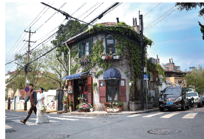
■黄县路百年老街混搭了时尚元素，成为年轻人拍照打卡地。