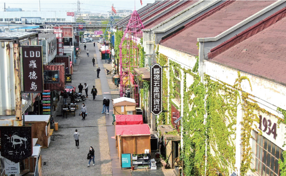
■青岛纺织谷的国棉五厂旧厂房增加时尚气息。 赵健鹏 摄于4月29日