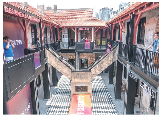
■改造升级后市南区银鱼巷老建筑，成为游客打卡地。 杨志文 摄于5月19日