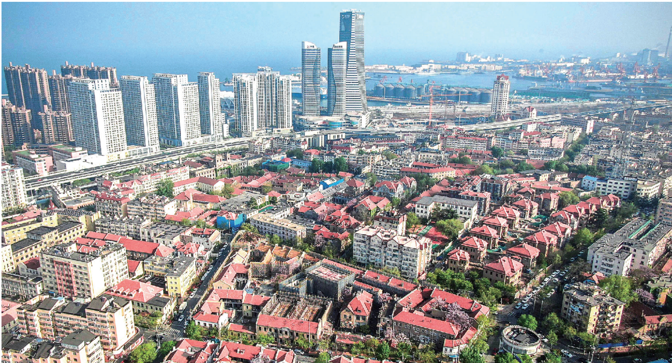
■预计今年8月亮相的刘子山别墅群与青岛国际邮轮港区在同一时空交汇。