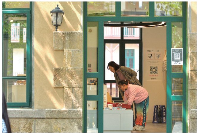
■海泊路老建筑里的店铺颇具特色。于 滔 摄于5月15日