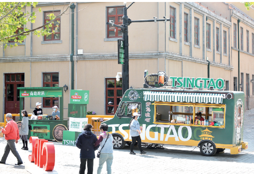
■大鲍岛文化休闲街区。 邢志峰 摄于5月2日