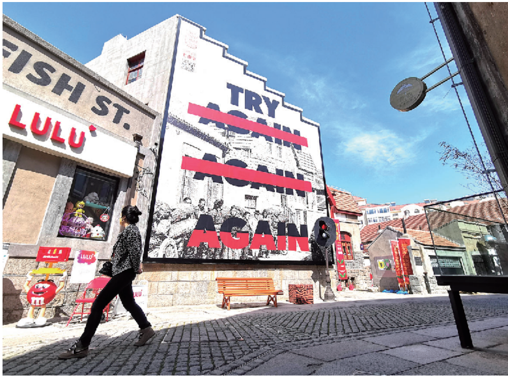
■在宁阳路老街触摸时代脉动。 赵健鹏 摄于4月26日