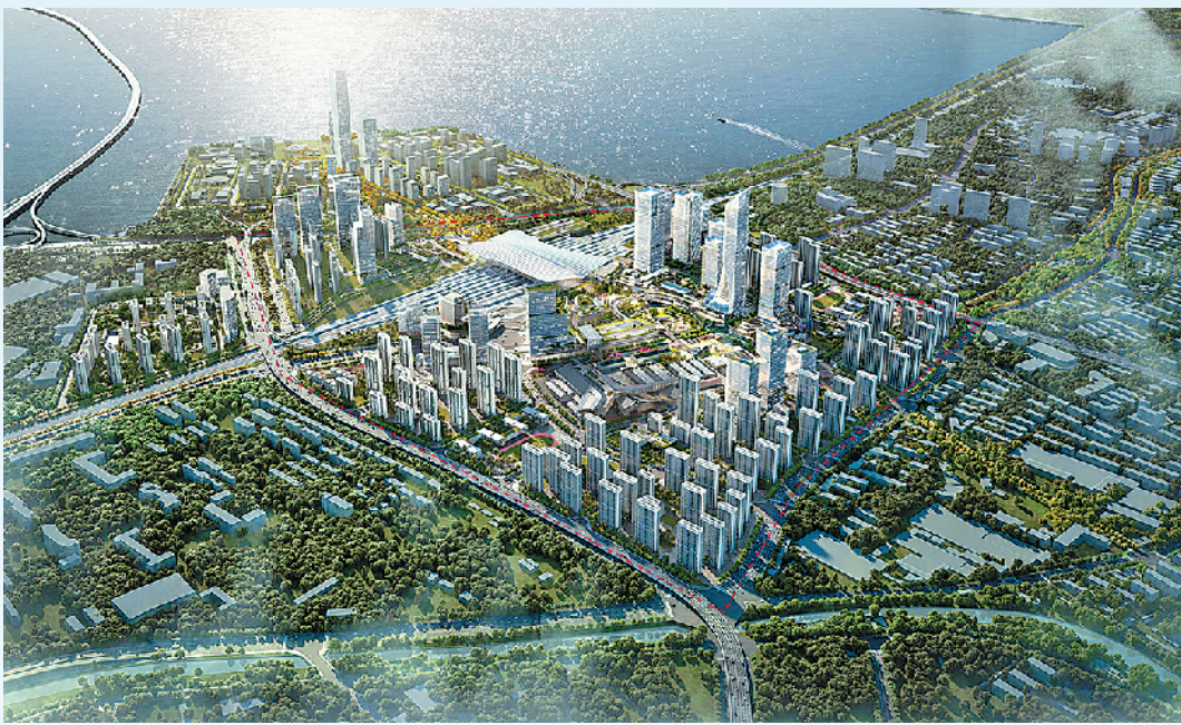
■青岛TOD开发一号工程和低效片区利用重点工程——青岛创新创业活力区效果图。

发展的根基更为坚实。加上三期规划项目,青岛地铁获批里程达503公里,位列全国第九位。目前,三期规划线路已有5条开工,剩余的两条线将在今年上半年开工。届时,全市在建线路将达到11条,219公里,规模前所未有。