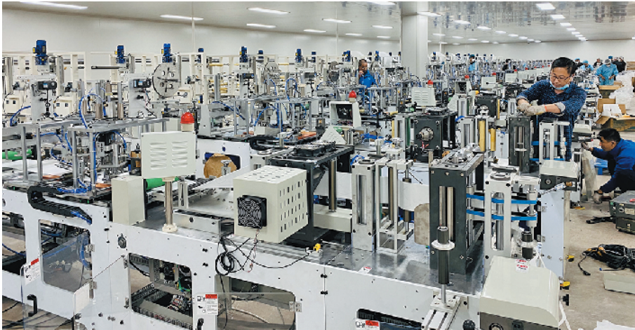
■海氏海诺生产车间内,工人在维修机器设备。

经济发展的根基在于市场主体。只要稍加观察就可以发现,进入新发展阶段后,市场主体正在成为一个超高频词汇。每当论及宏