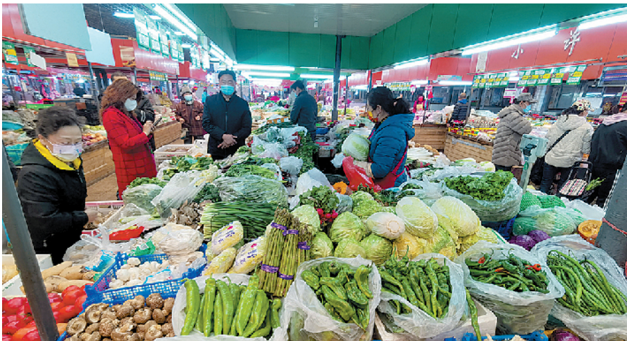
■青岛一家农贸市场内,市民在菜摊前精心挑选蔬菜。