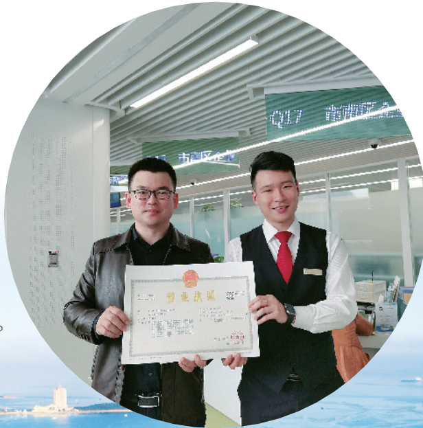
■为企业提供全流程高效服务体系。