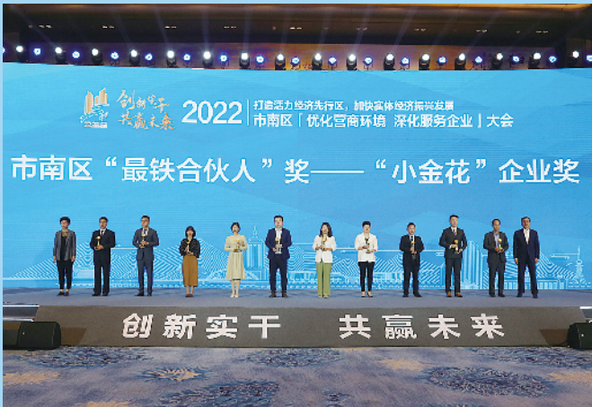
■市南奖励“最铁合伙人”。

今朝胜往昔，蓄势再出发。市南区正在锚定加快建设社会主义现代化国际大都市样板区目标，坚定不移打造活力经济先行区，发展六大主导产业，为企业家提供了重要机遇和广阔空间。市南区将因势而谋、优化政策、强化举措、深化服务，统筹各类资源、链接各种要素、政企协同，向每一名敢于追梦的企业家兑现“选择市南就是选择机遇，扎根市南就是扎根沃土，拥抱市南就是拥抱未来”的美好诺言。（刘洋）