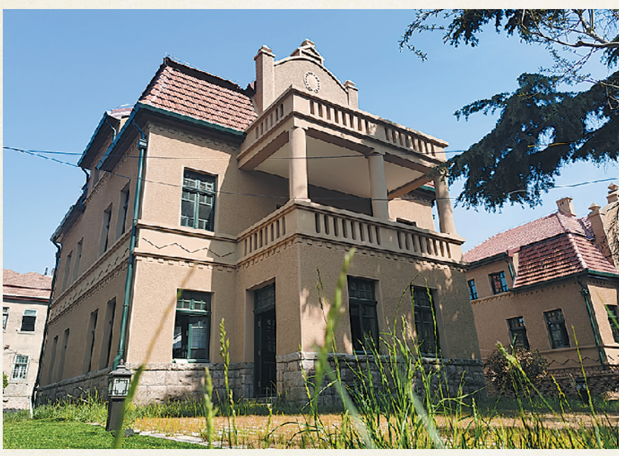
■已经修缮完工的武定路18号刘子山别墅。

提起刘子山，老街里的老街坊总能和你唠上几句。这个野心与智慧兼备的商贾传奇的命运，曾和早期青岛城市化的走向彼此勾连、交缠。 20世纪50年代中期之前，刘子山的房产几乎遍及青岛主城区的黄金地段，“刘半城”的名号由此而来。历经百年风云变幻，如今，青岛最早成片开发建造的建筑群落——刘子山别墅群被保存下来，成为除八大关外，唯一一处大体量、成片区的别墅群，其档次之高、保护之完好，在青岛极其罕见。 刘子山别墅群由上海路、武定路、宁波路和上海支路围合而成，总占地面积1万余平方米，总建筑面积6527平方米，共建有19栋别墅。镂空的十字花院墙，外加棋子腰线修饰，如今，走在武定路上，部分已经修缮完工的刘子山别墅让人眼前一亮；耳畔传来施工的吱吱啦啦、叮叮咚咚声，则像是历史城区重焕生机的前奏。 刘子山别墅群的修缮历经较长时间的酝酿，这和其复杂的历史不无关系。刘子山别墅群原本用作“家屋”，但是港口区的快速发展带来了大量的租房需求，刘子山便将部分别墅出租给高级职员以赚取丰厚的租金。刘子山病逝后，这19栋别墅房产所有权的继承完成分割登记，别墅由代理人统一对外出租，同时，也有刘子山的个别子女将分到的房产出售。“正因如此，修缮别墅之前，我们曾耗费大量的时间找寻档案，要以档案为参照，对搭建、改建得‘面目全非’的别墅进行‘绣花式还原’。”城建项目负责人邢东鹤说。 选取样本修缮，汲取经验，再大规模复