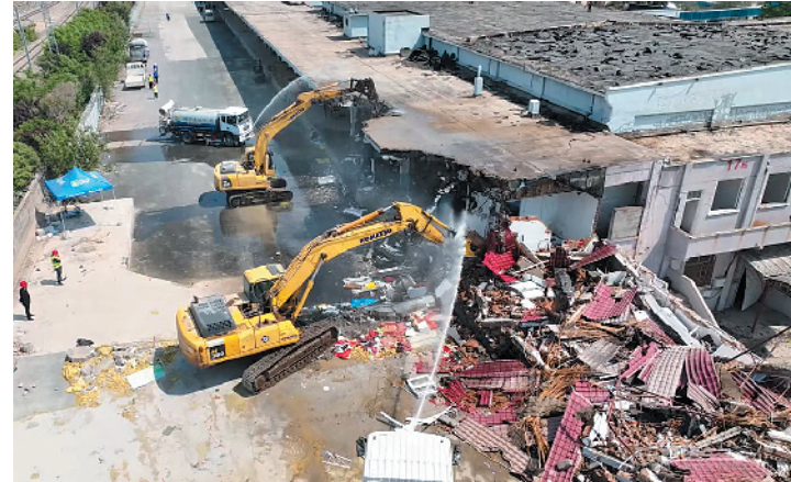
■李沧区振华路街道青联公司拆违现场，2 台挖掘机正在“挥舞手臂”拆除存量违建。

在李沧区振华路街道青联公司拆违现场，2 台挖掘机正在“挥舞手臂”拆除 3000 余平方米存量违建。青联公司位于青岛市“城市更新和城市建设三年攻坚行动”重点工程安顺路打通工程南段规划路线上，助力安顺路打通工程，李沧区正在进行青联公司厂区搬迁和违建拆除工作，在不久的将来，