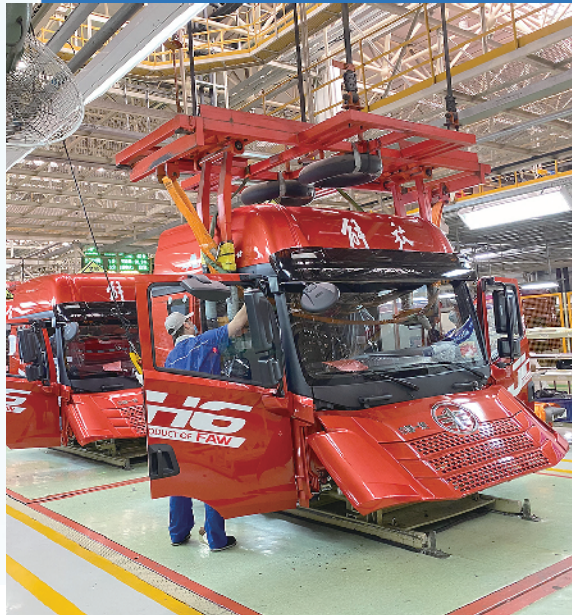
■青岛一汽解放生产车间。

汽车人才教育培训产业是汽车产业可持续发展的基础性产业。汽车城将引进和规划建设2-3家与汽车研发、生产、营销、维修、管理等相关的教育培训机构,以培训产业工人为主,支持企业推行订单培养、定岗实习等人才培养模式。同时,吸引汽车专业高等院校(或高职院校)及高校汽车研究生院入驻,开展汽车及相关专业本科、研究生学历教育。