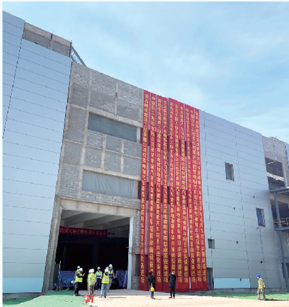
■奇瑞汽车青岛基地乘用车项目喷涂车间。