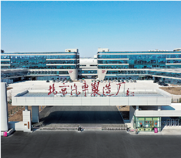
■北汽制造青岛总部整车基地。