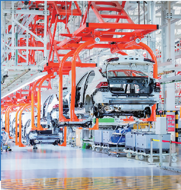
■位于即墨区的一汽-大众华东基地汽车生产线。