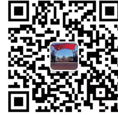
青岛工贸职业学校招生咨询二维码