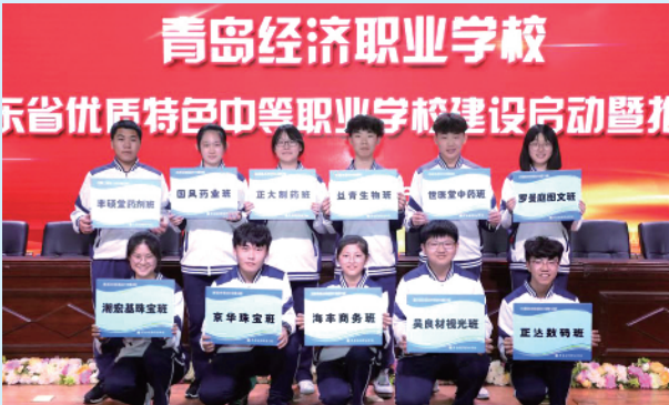
■企业争相在青岛经济职业学校设立冠名班。

创建于 1956 年的青岛经济职业学校始终把培养“有尊严的掌握一技之长的职业人和综合素质高的幸福的社 会人”作为发展目标,立足学生综合职业能力养成,聚焦学生多元升学和优质就业,深入实施“提质培优”工程,实现了“出口畅、进口旺、中间提质量”良性循环,保障了学生健康成长和学校快速发展。