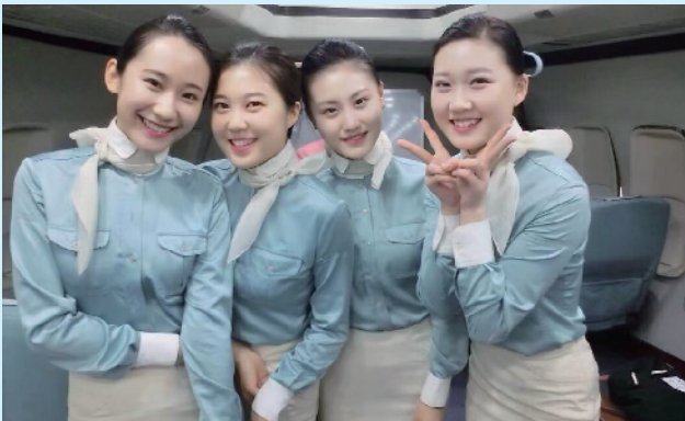
■青岛旅游学校毕业生就职于航空公司。

落实新修订的职业教育法,青岛旅游学校秉承“人本立校”的办学理念,坚持“适合的才是最好的”,以打造“省内领先、全国知名、具有国际影响力”的优质特色学校为发展目标,在培养爱党爱国、技能娴熟、外语流利、气质优雅,具有国际视野,集服务型、技能型、创新型于一体的综合素质高、德技兼修、可持续发展的现代旅游业复合型人才的道路阔步前进。