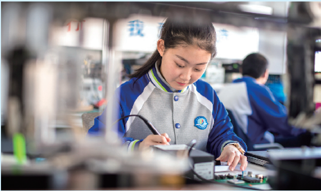
■青岛电子学校学生上专业课。

“3+4”学生连续 6 年百分百转段,成功进入青岛科技大学就读本科;普职融通班职教高考本科整体达线率约为九成,更多学生升入本科院校;毕业生连续多年“组团”考上名校研究生,创造职教学生“逆袭奇迹”……近年来,青岛电子学校秉承“成就一个学生、幸福一个家庭、奉献整个社会”的办学理念,不断刷新着岛城中职学生升学、深造的高度与宽度,形成了岛城职教学生升学发展的“电子现象”“青岛样板”。