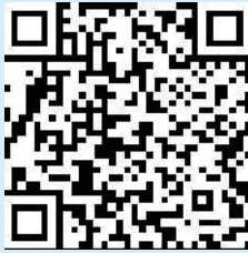
青岛电子学校 2022 年招生咨询群