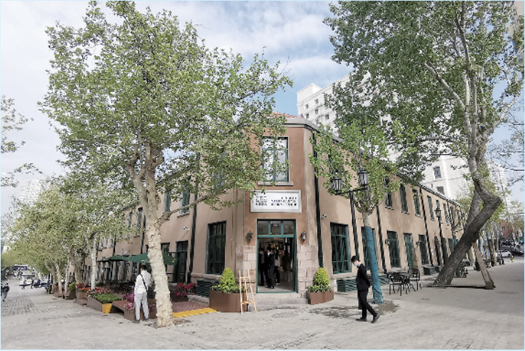
■新业态不断导入历史城区。