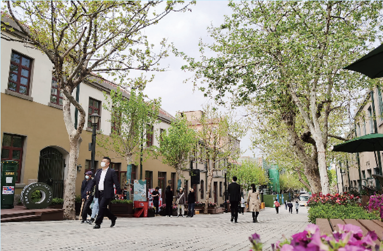
■市北区大鲍岛文化休闲街区更新已颇具成效。

4 月 28 日，以中山路、大鲍岛为代表的青岛历史城区迎来历史性时刻——总投资 40 亿元的 72 个历史城区保护更新项目集中开工，重振老城活力的“决战”在基础设施建设、建筑保护修缮、全新业态导入等领域纷纷打响。此次集中开工项目涉及市南区中山路片区、劈柴院片区等 9 个片区和市北区四方路片区、馆陶路片区等，其中备受市民游客关注的中山路主街、劈柴院、浙江路广场、四方路、馆陶路以及“沉睡”多年的伊都锦大厦、东方贸易大厦等都将有新动作。