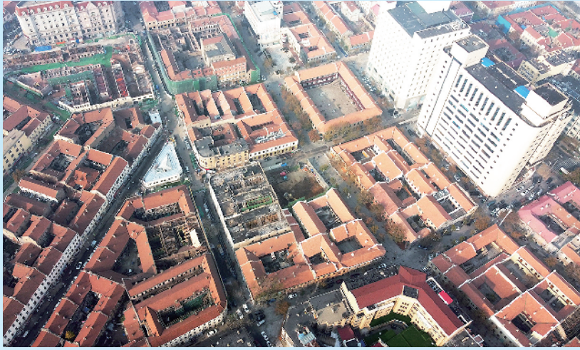
■航拍里院。