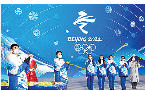
■1月27日晚间，颁奖礼仪人员和志愿者在参加颁奖流程演练。