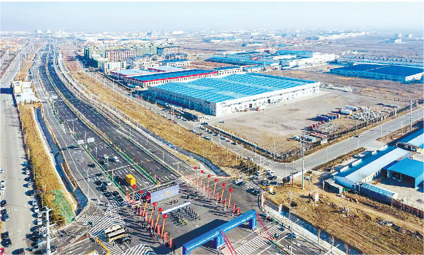
■2021年12月30日，G204烟沪线莱西段改建工程完工暨通车启动仪式现场。

进经验，加强与省“十四五”规划和胶东经济圈一体化发展规划衔接的基础上，“双莱”先行区发展定位和突破路径也逐步明晰。