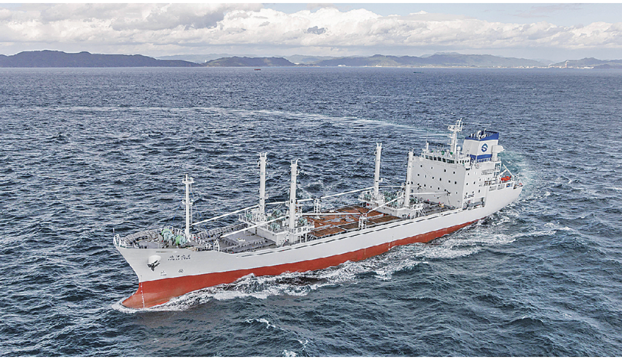
■“海洋之星”采用最新冷媒技术,冷冻过程中不释放破坏臭氧层物质。

目前,“海洋之星”轮已获得了每年 5000 吨的蓝鳍金枪鱼海上加工合同,作业量占全球蓝鳍金枪鱼加工总量的八分之一。