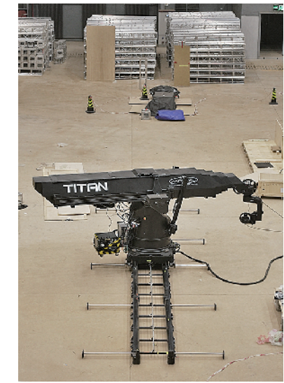
■Titan 运动控制机械臂运抵东方影都,是其首次在亚洲亮相。

□青岛日报/观海新闻记者 王 凯 本报 1 月 19 日讯 机械臂高度最高可达 8.7 米,最长移动距离 12.98 米,可负载 45 千克的摄影机重量……在东方影都 22 号摄影棚内,一台庞大的机械设已经安装完毕,投入到电影《流浪地球 2》的拍摄当中。这台名为“Titan”的装置,由马克罗伯茨运动控制公司(MRMC)设计,是其最大的运动控制机械臂,此次从英国运抵青岛,是其首次在亚洲亮相。Titan 的投入使用,象征着中国电影工业的迅速发展,也显示出灵山湾影视文化产业区蒸蒸日上的势头。以还将继续拍摄 70 天左右的《流浪地球 2》为代表,目前电影《异人之下》《731》《翻译官》等多部电影均在紧张拍摄中,东方影都影视产业园迎来 2022 年“开门红”。据悉,目前东方影都 40 个摄影棚几乎全部处于使用状态,摄影棚出租率达到 97.25%,达到了历史新高。