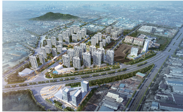
■和达·幸福城效果图

作为青岛城市更新领先企业,和达集团始终把保障村民利益摆在首位,在土地整理实施过程中,全盘考量,想村民所想、为村民所为,从升级居住品质、升级生活品质入手,精心打磨安置区规划方案、户型设计、园林景观等。同时,综合考虑村集体经济发展物业形态、运营模式等,最终实现村民切身利益、村庄集体经济发展的融合共赢。