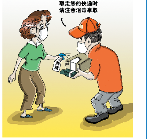
■收快递时应进行消毒。漫画 金 琳

不过,对于快递可能带来的传染风险,也不必过分担忧。日前,国家邮政局市场监管司副司长边作栋表示,目前还没有快递小哥和用户因为接触快递包裹而染上疫情,现在看来疫情通过接触快递包裹而传播的风险并没有进一步加大,但仍然建议广大用户要加强自身防护。