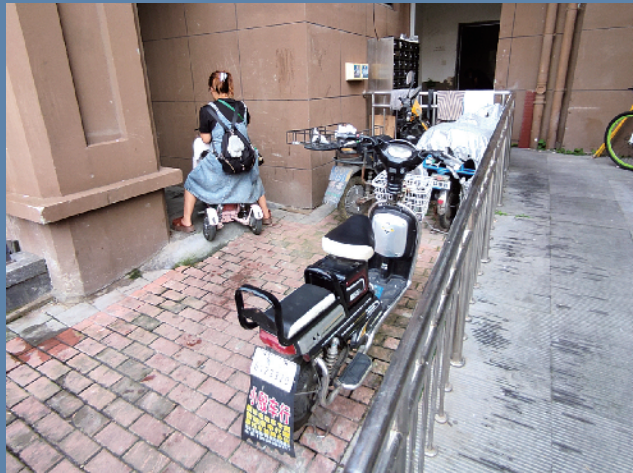
■在市南区保障房小区,一位居民正骑着电动自行车进入楼道。

由于缺乏前期规划,后期安装又遭遇诸多阻力,电动自行车停放场所和充电设备的缺口,成为目前岛城居民小区面临的不可回避的现实难题,也日益演变为影响广泛的基层治理难题。未来,如何从规划立法入手,增设相关设备、落实配套细节、畅通小区民意、提高全民安全意识,都是这个解题进程中必须考量的具体要点。而这一进程的推进,不仅需要切实落实民生至上的理念,同样需要拿出真作为的态度、敢作为的勇气。只有职能部门、基层社区、物业企业和广大业主同心合意、相向而行,才能彻底解决难题,尽快让电动自行车在小区顺利“安家”。