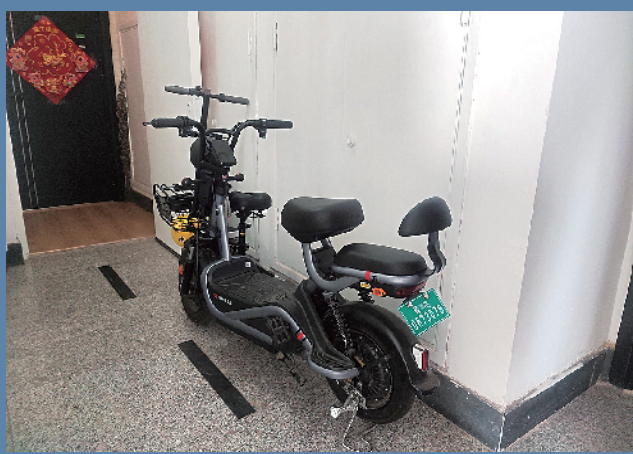
■在崂山区东城国际小区,一辆电动自行车停在楼道里,堵塞了半个通道。