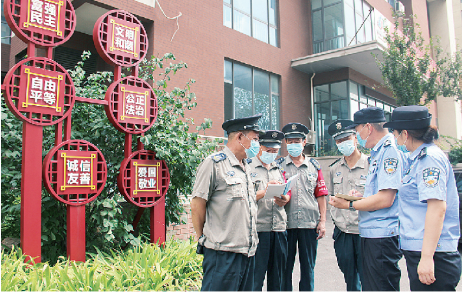
在普吉新区小区，派出所民警和物业人员收集汇总入户走访征求到的意见。

随着居民电动车保有量的增多，电动车充电引发的火灾事故频发。特别是在高层居民建筑内，电动车充电时电池爆炸引发火灾后， （下转第七版）