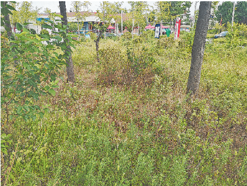
■青岛路休闲文化广场绿化带内,荒草成片疯长。