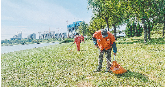
■养护人员清理公园内散落的垃圾。

本报 8 月 23 日讯 本报 8 月 17 日刊发《免费景点：风光好,奈何管理不“配套”》报道,反映祥茂河湿地公园存在露天烧烤无人制止、垃圾散落清理不及时的问题,高新区对相关问题进行了落实和整改。