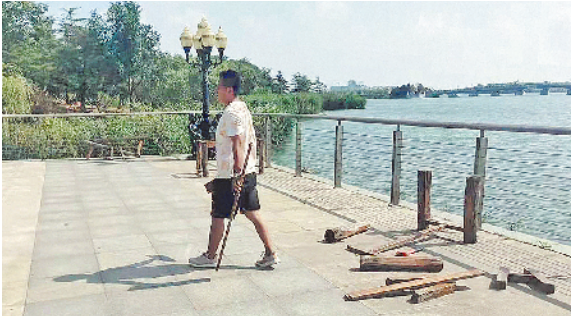
■工作人员维修少海湿地公园观景台。

本报 8 月 23 日讯 本报 8 月 17 日刊发《免费景点：风光好,奈何管理不“配套”》报道,反映胶州市少海湿地公园景区硬件设施出现破损,胶州市对相关问题进行了落实和整改。