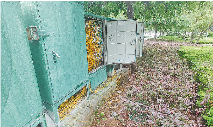
■百通广场旁的光缆交接箱门敞开,露出内部的线缆。

“公共广场是展现城市魅力的名片,体现着一座城市的待客之道。以争创全国文明城市典范城市为契机,相关部门不妨梳理出公共广场的共性问题,为其管理维护寻找解题之策,让公共广场更好地发挥城市客厅的作用,提升城市品质。”有市民在采访中建议,公共广场应纳入城市网格化管理,不要因管理“失守”而造成公共广场失修,因城市客厅有碍观瞻而有损城市的文明形象。