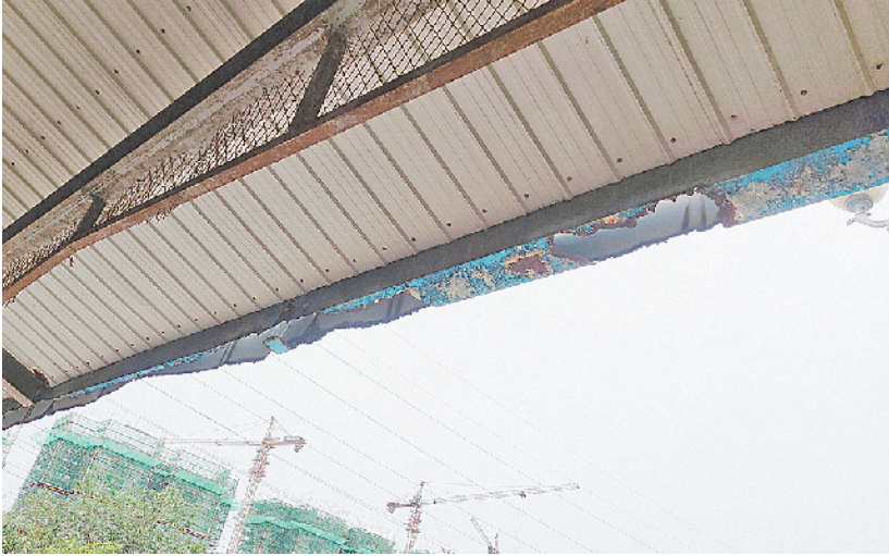
■隐珠广场的休闲铁棚锈蚀严重。