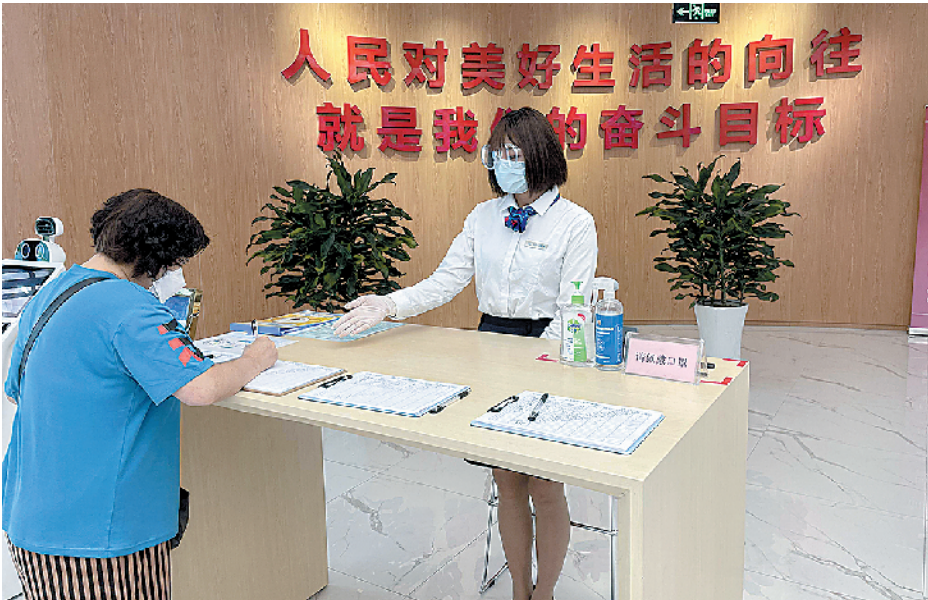
■青岛市民中心入口处,前来办事的人员正严格进行防疫登记。

记者了解到,由于青岛市民中心人流量大、人员来源复杂,做好入厅人员的初步筛查至关重要。为此,青岛市民中心分别在大厅及停车场等8处入口位置,设置测温验码点。对于进入青岛市民中心的每一位办事群众,实行“机器人无