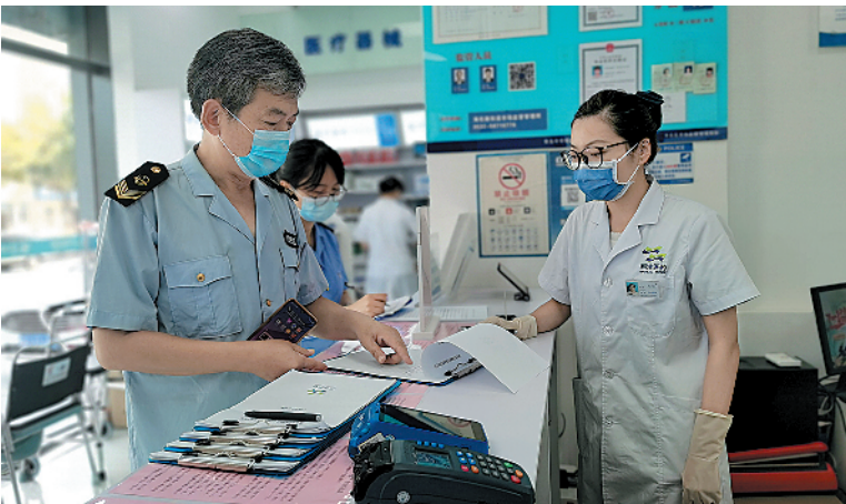
■市北区市场监督管理局工作人员对药店疫情防控情况进行突击检查。

“在新冠疫情防控背景下,零售药店有如前线‘哨点’,发挥着预警监测的作用。”市北区市场监管局药械监管科杨葆介绍,为了强化零售药店防疫工作,前期,市北区已通过微信群、会议培训、线上考试、检查督导等方式,对辖区446家药店培训疫情防控要求,力争每家药店、每位店员都能紧绷疫情防控常态化之“弦”。组织药店自查自纠,制定明白纸,从进店到购药,从登记到回访各个环节细化要求、明确措施,即“三个务必一个尽早”:务必做到购药登记,务必按期应检尽检,务必做好入店安全,尽早接种新冠疫苗。除此之外,通过网格化监管,市北区已集中开展两轮全覆盖检查,持续开展药店疫情防控专项整治,督导检查药店落实进店管控、购药信息登记、环境安全等情况,截至目前,累计检查药店1300家次,对70余家落实