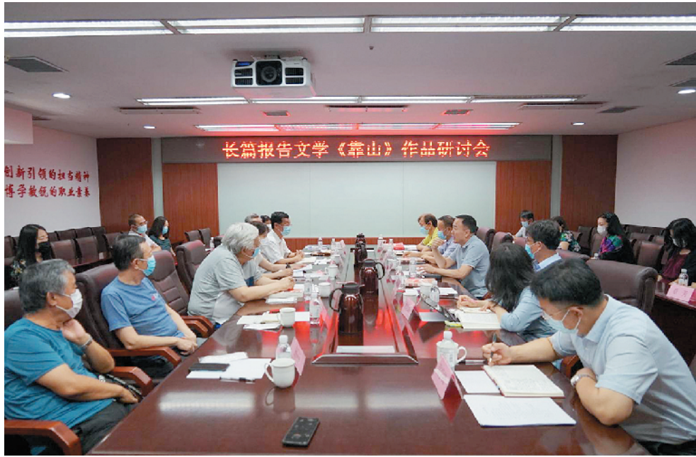
■长篇报告文学《靠山》作品研讨会现场。

为了创作这部向人民致敬、为人民立传的作品,铁流从2007年开始搜集资料,足迹遍及山东、河北、江苏、安徽、湖南、江西、陕北等地,积累资料数亿字,采访笔记达上千万字,走访战争年代的亲历者、见证者和他们的后人上千人。本着要写得“好看接地气”的原则,避免“高大上”和“空洞的说教”,他努力从人性、人物内心世界着手,着眼于细节和朴实,力争用文学的语言来叙述真实的故事。他认为,忘记了过去就意味着背叛。在历史的长卷中,有无数的画面都值得今天乃至明天的人们去不断追忆和抚摸。文学有着浸润人心和催人奋进的力量。以人民为中心,为人