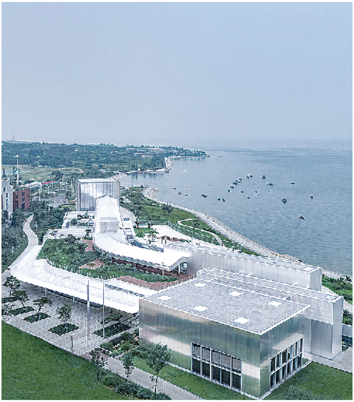
■从不同角度欣赏西海美术馆。