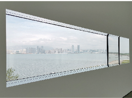
■西海美术馆独特的展厅设计让参观者“移步换景”。