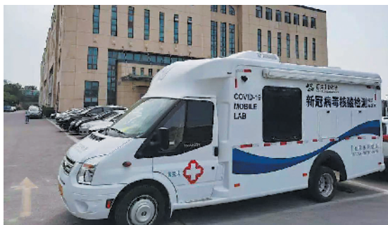
■新冠病毒核酸检测车。