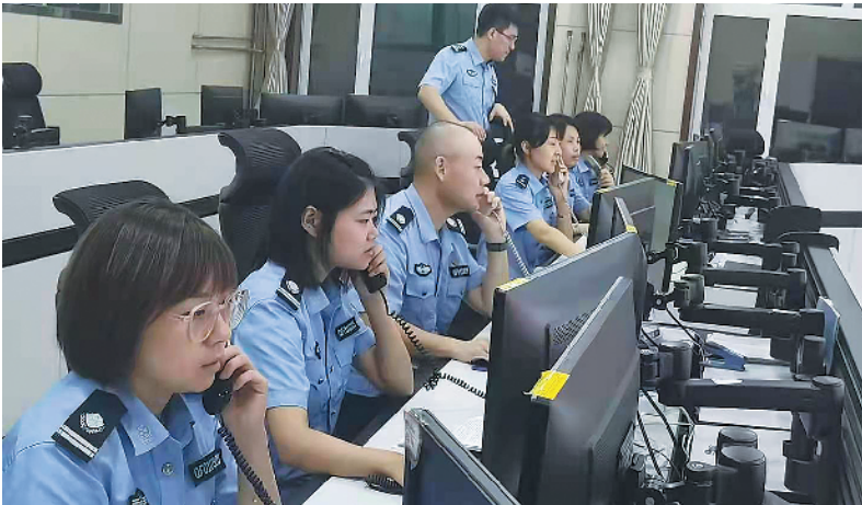
■青岛市公安局市南分局的民警在进行电话随访。

中心,派出所与镇街、社区密切协作的三级联动机制,确保第一时间核查、第一时间管控,实现通报、核查、落地、处置、管控全链条闭环管理,最大限度降低疫情扩散蔓延的风险。