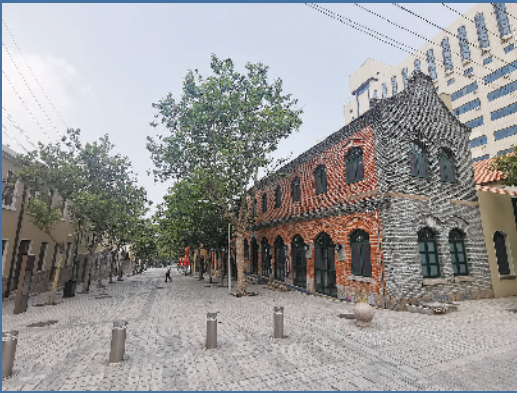
■四方路片区步行街上行人稀少。