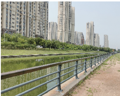
■高新区丰年路景观河步行道破损的供电设施已清理干净。