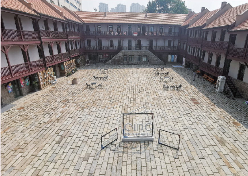
■成为青岛工业设计创新中心的广兴里人气不足。

到中山路西侧的宁阳路片区探访。该区域紧邻青岛火车站,片区内有8个里院,其中不乏文保建筑,是中山路启动最早、进展较快的历史城区保护利用项目。7月初,宁阳路银鱼巷刚刚举办了为期4天的“艺术营造节”。