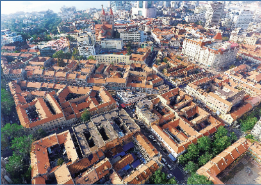
■四方路片区保留了大量里院建筑。

作为青岛人独创的民居建筑形式,里院融合了中国传统四合院和西方商住式公寓楼房建筑特点,不仅是青岛老城区建筑的重要代表,也是青岛建筑文化的标志性符号。前期,借助老城区复兴的东风,部分里院实现了全面改造升级,也被坊间寄予厚望。但由于整体规划错位,业态单一,旅游吸引力严重不足,修缮一新的街区游客稀少、门可罗雀。拥挤热闹的胡同、锈迹斑驳的过道、油光发亮的台阶……很多“老青岛”最怀念的里院独有的市井喧嚣和烟火味道,似乎在这样的清冷中成了渐行渐远的记忆。缺少“烟火气”,成为里院改造后的最大槽点。就此,有专家认为,通过规划变更,推出全新业态,注入青岛元素,再聚火爆人气,将其打造成老城区独有的中高端文创旅游空间,是破解目前里院发展困境的最佳选择。