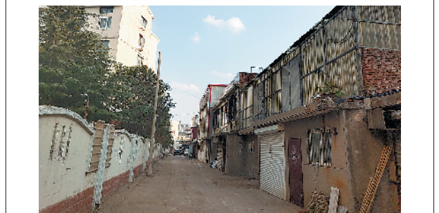
■即墨区坊子街与龙福家园小区之间的小巷内,杂物和简易房已被拆除、清理。

本报8月8日讯 本报8月5日刊发《背街小巷:被遗忘的角落?》报道,反映西海岸新区烟台路580号南侧无名路路面破损以及排水渠被垃圾堵塞等问题,西海岸新区对相关问题进行了落实和整改。 经落实,该无名路为心怡苑小区外的配套道路。根据《民法典》《山东省物业管理条例》等相关规定,物业保修期满后,物业管理区域内共用部位及共用设施设备的维护和管理责任,由业主共同承担。经街道与物业协调,物业初步计划对该处道路进行整体硬化。 8月5日当天,物业便联系施工单位对无名路进行了测量,并制定施工方案和核算费用。后期,物业将对施工方案和报价进行公示,征求业主意见,由业主分摊施工费用。在方案敲定之前,物业已于8月6日对严重坑洼的路面进行了临时修补。 针对该条无名路周边绿化带以及排水渠积存垃圾的问题,街道已联合物业进行了彻底清理,针对排水渠排水不畅的问题,街道已协调相关部门查看了该处的规划设计图纸。下一步,将根据规划设计图纸和各部门具体要求,研究该处排水渠改造方案,确保排水顺畅。