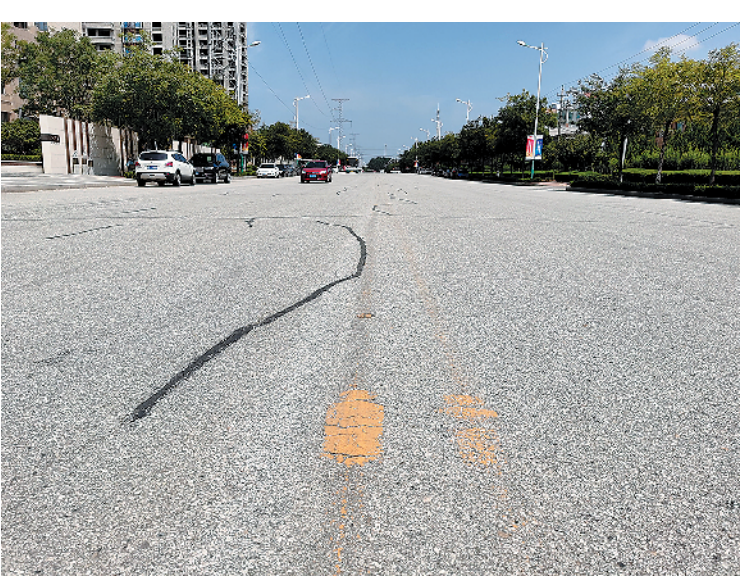
■莱西市香港路上,路面标线模糊不清。