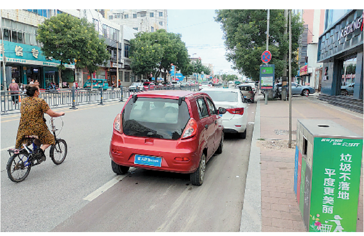
■在平度市郑州路,机动车占据自行车道,市民不得不在机动车道上骑自行车。

主次干道是城市道路系统的骨架,在城市运行中起着重要的作用,其管理水平的高低,与市民生活息息相关。近日,记者探访发现,我市部分主次干道存在交通秩序混乱、车辆乱停乱放、设施维护不到位等问题,既影响了道路通行效率,又降低了区域环境品质。 “争创全国文明典范城市,城市主次干道要实现高水平管理,城市交通也是一道文明风景线。俗话说:道路通,百事通。家门口有条安全通畅的好路对我们太重要了。”采访中,有市民表示,希望相关部门提高意识,加强城市交通治理,为广大市民营造安全便捷的出行环境。