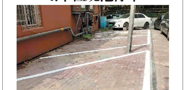
■李沧区兴城路街道联合相关部门在背街小巷划出车位线,确保规范停车。

止”,致使问题没有得到彻底解决,甚至引发“并发症”。解决城市交通的秩序问题,如若不投诉、不督查就歇三分,其结果必然是问题回潮或并发。整治工作少些“走过场”、多些“动真格”,像钉钉子那样持之以恒,一锤接着一锤,一定会钉准、钉实、钉住问题,一定会让百姓服气、让百姓满意。 此外,城市交通作为连接城市肌理的经络,是一道有关人与人、人与车、人与城市如何相处的综合题。探寻破题之路,实现“路畅其流”,终究要指向深层次的“道”——在“管”上环环相扣,通过全周期管理,做到多管齐下、联合会诊、问题共答。比如,交警部门严惩逆行、乱停等行为,城市规划、建设部门加大停车场规划建设力度,交通运输部门提高公共交通通达率……各部门只有左右衔接、同频共振,方能既治标又治本,既治已病又除未病。