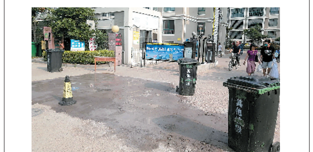
■西海岸新区烟台路580号南侧无名路的破损路面已被临时修补。

本报8月8日讯 本报8月5日刊发《背街小巷:被遗忘的角落?》报道,反映李沧区多条背街小巷存在乱停车、堆放杂物的问题,李沧区对相关问题进行了落实和整改。 经落实,报道刊发的无名路周边多为建于上世纪八九十年代的职工宿舍楼,由于历史原因,居民楼在规划之初未建设停车区。随着车辆增加,居民停车难日益凸显。报道刊发后,李沧区综合行政执法局联合兴城路街道办事处、李沧交警等部门到现场落实情况。目前,执法中队组织人员已清除了兴宁路、兴城路35号、四流中路351号附近的占路地锁、条石等杂物。 下一步,李沧区将加大执法巡查力度,依法查处居民区公共区域违法设置地桩、地锁等行为。同时发挥社区居委会的作用,及时劝阻、改正居民私占停车位的行为,对拒不改正的,发挥街道及辖区执法中队的作用,依法予以查处并清理。此外,兴城路街道办事处将联合消防部门、交警部门在无名路上划出车位线,规范停车秩序。