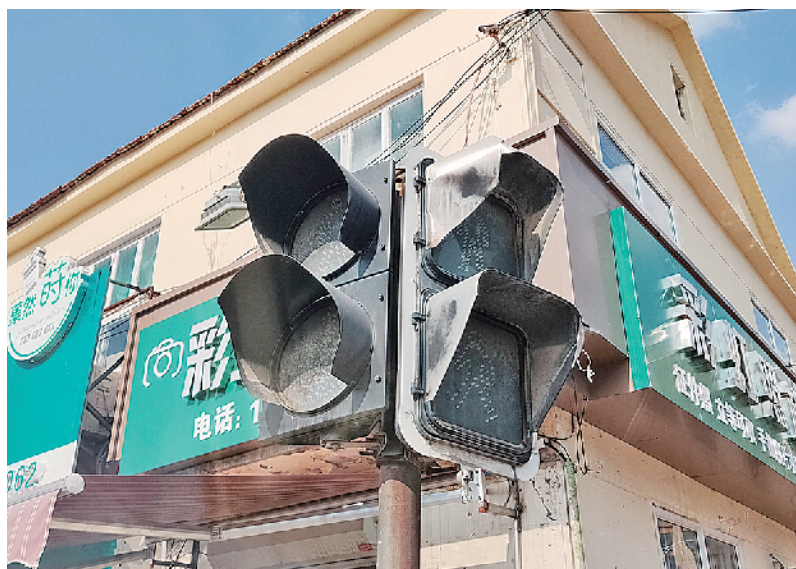
■胶州市北京路、常州路路口的信号灯出了故障。