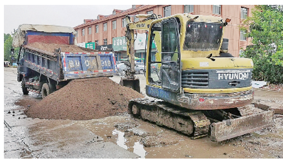
■施工人员对莱西市大连路破损严重路段进行整修。

本报8月5日讯 本报8月3日刊发《城乡接合部：硬件存短板 治理有盲点》报道反映莱西市大连路东段路面存在坑洼不平的问题，莱西市对相关问题进行了落实和整改。