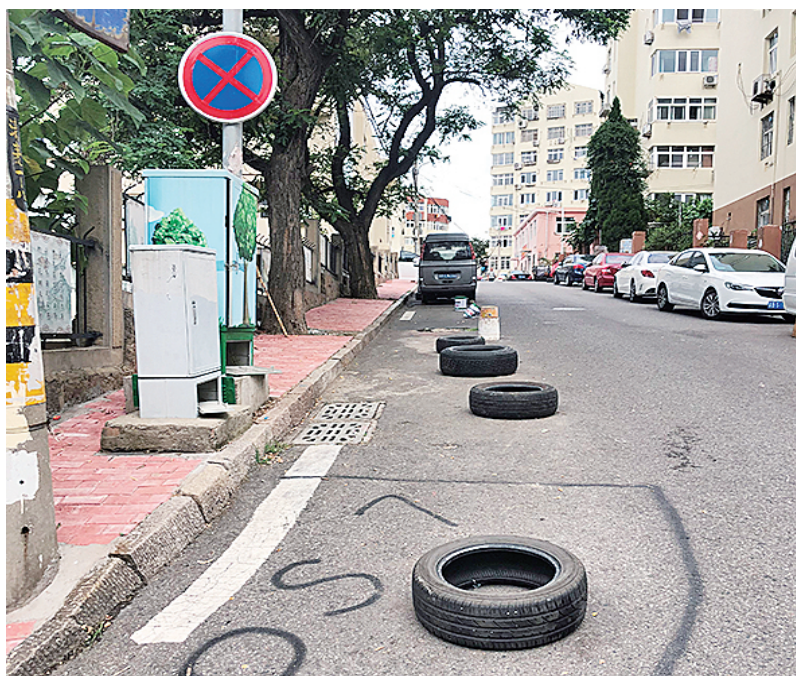
■重庆路第三小学附近路边有人用旧轮胎占车位。

作为城市的重要组成部分，学校是城市治理的重要区域，也是创城指标体系中的重要节点。近日，记者在探访部分区市的学校周边时发现，交通信号灯损坏、设施挤占人行道、车辆乱停道路拥堵、电缆垂落人行道等问题亟待相关部门打出“组合拳”综合施策，治理好学校周边的“新疾”和“旧症”。 “校园往往与居民区紧密相连，人流、车流密集，因此存在的问题也会相对较多。”采访中，有市民希望相关部门在做好开学前集中整治行动的同时，能够加强常态化管理、建立长效机制，进一步改善校园周边的环境。