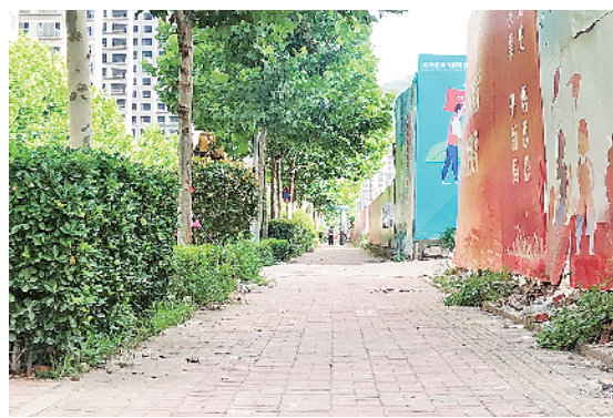
■崂山区姜哥庄路人行道上乱停的车辆已被清理。

本报8月5日讯 本报8月3日刊发《城乡接合部：硬件存短板 治理有盲点》报道反映崂山区姜哥庄路长期存在车辆乱停乱放、商贩占路经营、盲道被阻断问题，崂山区对相关问题进行了落实和整改。