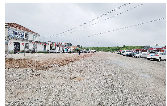
■城阳区仲村生鲜农贸市场开始平整铺装院内道路。

本报8月5日讯 本报8月3日刊发《城乡接合部：硬件存短板 治理有盲点》报道反映城阳区城阳街道仲村社区的生鲜市场周边环境脏乱差问题，城阳区对相关问题进行了落实和整改。