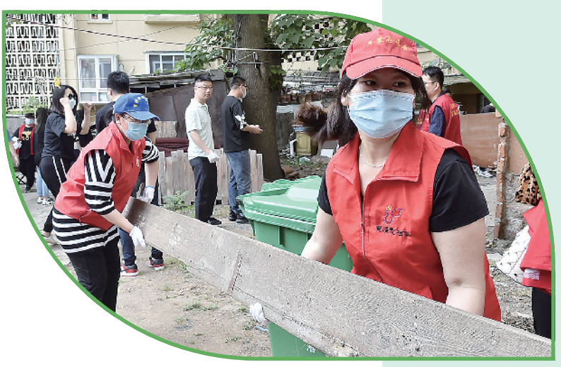
▲市北下沉干部、网格工作人员和志愿者放弃周末休息,为居民清理老楼陈年废物和垃圾。