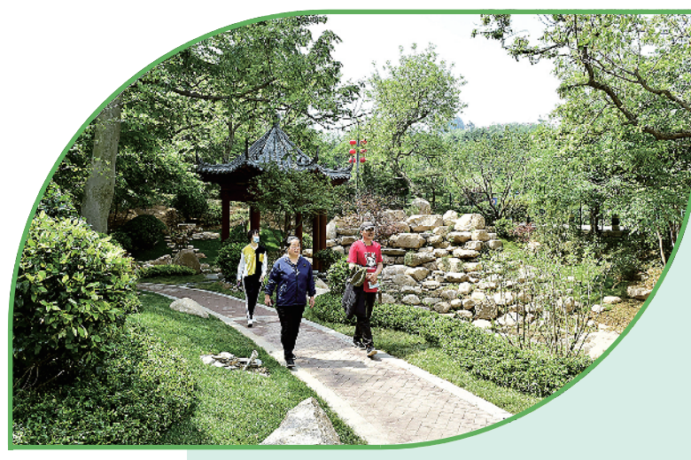
▲在绿化攻坚中,市北区利用拆迁空地、废弃土地等改建口袋公园。图为市民在太平山路口袋公园散步。