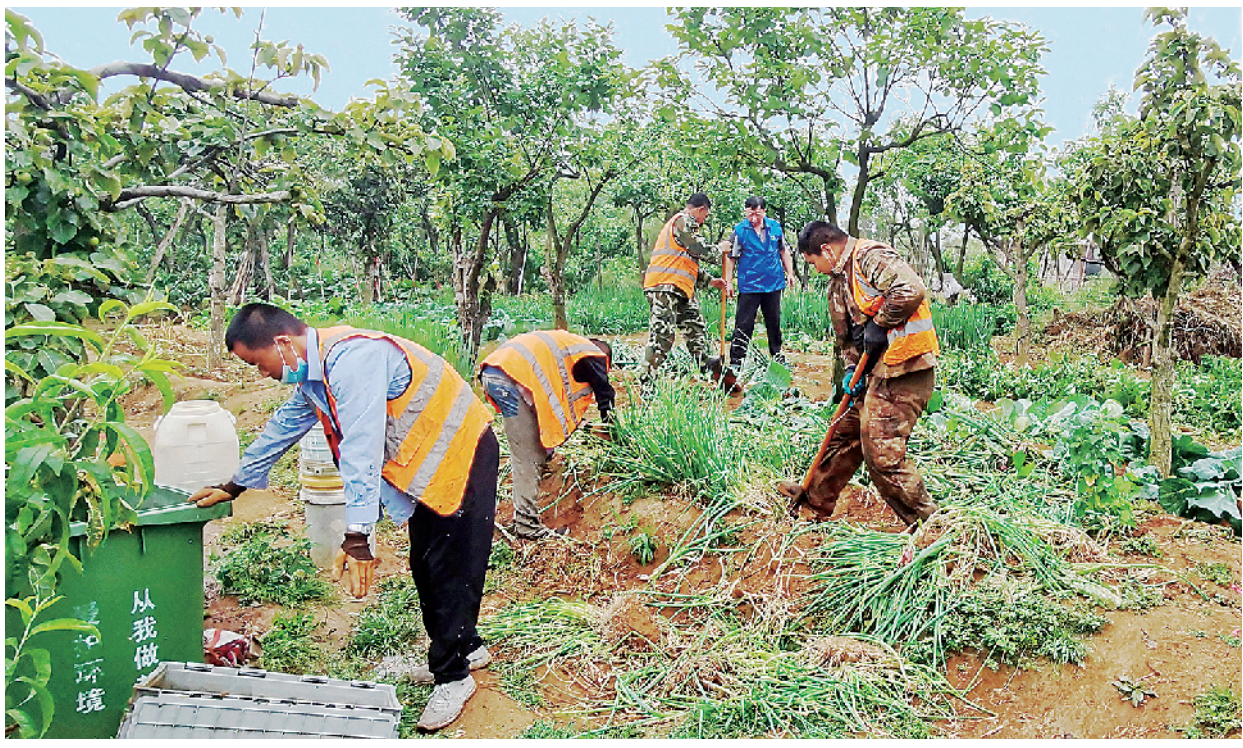
■相关单位联合执法,整治浮山北麓私自围圈的菜地。

为此,全区1000多名党员干部放弃双休日,下沉到街道、社区,发挥各单位业务优势,帮助一线群众解决下水道堵塞、居民楼路面坑洼破损等关系到居民生活的问题7000余个。与此同时,市北区充分运用“科技+”和“互联网+”等技术赋能创城和基层治理工作,持续深耕“一核多元、一网统筹、一呼百应”的党建引领基层治理“市北模式”,充分发挥网格阵地、大数据平台、党群服务站、一线工作组、红色合伙人等特色优势,从制度、资源、人力、技术等方面创新“市北打法”,把“创城”的“独角戏”变成资源集聚、合力围剿、全员冲锋的攻坚战。