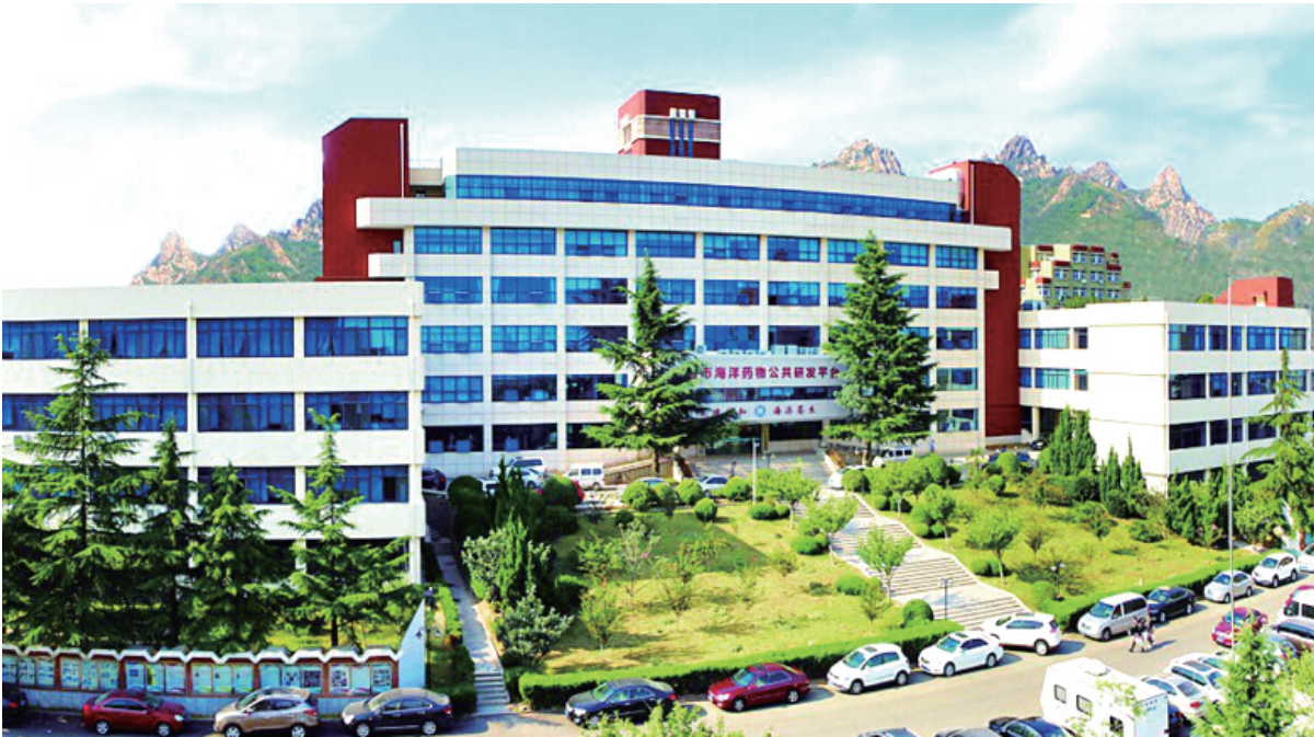
▲青岛海洋生物医药研究院。