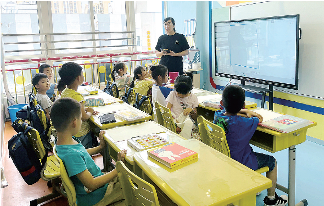
■孩子们在英语培训学校上课。

社会各界对“双减”政策的反应不一。记者采访发现，虽然各方还在等待相关实施细则的出台，但不少学校已经在布置课后托管事宜，提升教学质量、让学生在学