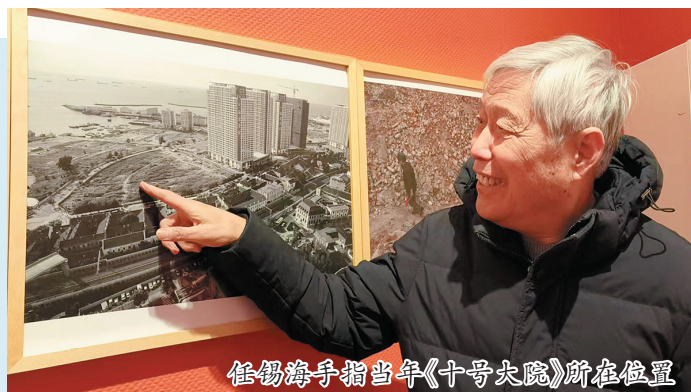
任锡海手指当年《十号大院》所在位置

12月21日,寒风凛冽,但青岛市美术馆大殿展区却是暖意融融,《青岛人——任锡海摄影五十年纪程展》在此举行。任锡海曾任中国摄影家协会理事、山东省摄影家协会副主席、青岛市摄影家协会主席,这次展览是对他摄影生涯的一次深入探看,也是对青岛人生活变迁的展现。